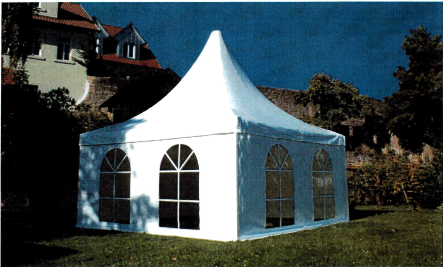
Abbildung enthält Sonderzubehör

Die Viereckpagode Festival Plus ist der optische Blickfang bei jeder Veranstaltung. Mit dem verwendeten Klappbindersystem wird die Montage gegenüber herkömmlichen Pagodensystemen erheblich vereinfacht und verkürzt. Dank neuester statischer Berechnung nach DIN EN 13782 ist die Viereckpagode Festival Plus auch in der Zukunft fit für Ihr Event.